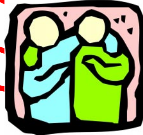
Ai miei amici