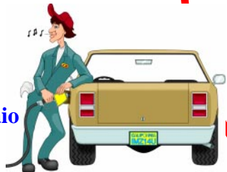
Al mio benzinaio