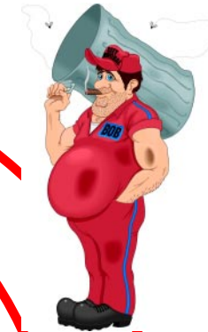
A chi vedo tutti i giorni con cui non parlo mai..