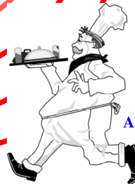
Al mio fornaio

Visto che l'idea è che io continui a portargli materiale ogni mese, per non lasciare tutto questo al caso, è necessario che io sappia come si chiama, dove posso trovarlo, il suo numero di telefono... per questo è importante che gli faccia riempire la scheda aderente.