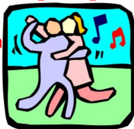
Al mio Amore..