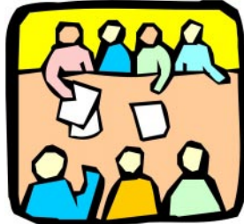
Ai compagni di lavoro