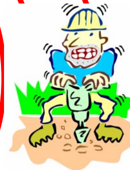
..anche a chi mi fa arrabbiare..